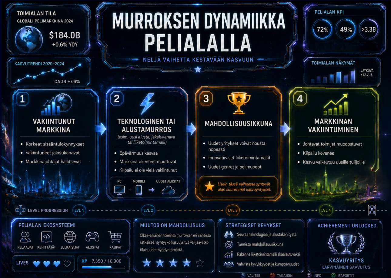
KUVA 1. Murroksen dynamiikka pelialalla

Samanaikaisesti pelialalla nähdään myös vastakkainen kehityssuunta, jossa pelinkehittäjät pyrkivät vähentämään riippuvuuttaan yksittäisistä alustoista. Monialustainen kehitys, alustariippumattomat teknologiat sekä pelien julkaiseminen useissa jakelukanavissa ovat yleistyneet. Tämän kehityksen tavoitteena on vähentää yksittäiseen alustaan liittyvää liiketoimintariskiä ja mahdollistaa pelien laajempi tavoitavuus eri markkinoilla. Pelialan alustarakennetta voidaan siten kuvata kaksisuuntaiseksi kehitykseksi: toisaalta uusia alustoja syntyy ja ne voivat tarjota kehittäjille uusia jakelukanavia ja yleisöjä, toisaalta pelinkehittäjät pyrkivät samanaikaisesti rakentamaan pelejä ja liiketoimintaa tavalla, joka ei ole sidottu yksittäiseen alustaan.